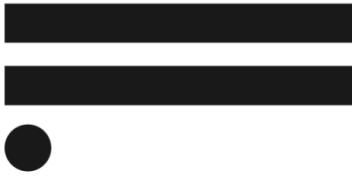
Tabla A4.3. Distribución de barrios según tipo de eliminación de efluentes cloacales